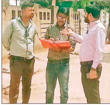
पर अतिरिक्त शुल्क देना पड़ेगा, इसलिए समय रहते भुगतान करना जरूरी है। टैक्स भुगतान को आसान बनाने के लिए निगम